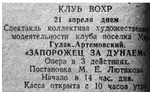
Фото 1. Советская Колыма. 1946. № 82 (20 апреля). С. 4 / Sovetskaya Kolyma . 1946. № 82, p. 4

Второе направление в деятельности самодеятельных музыкально-театральных коллективов на Севере Дальнего Востока, наметившееся в 1940 – 1950-х гг., – русская оперная классика.