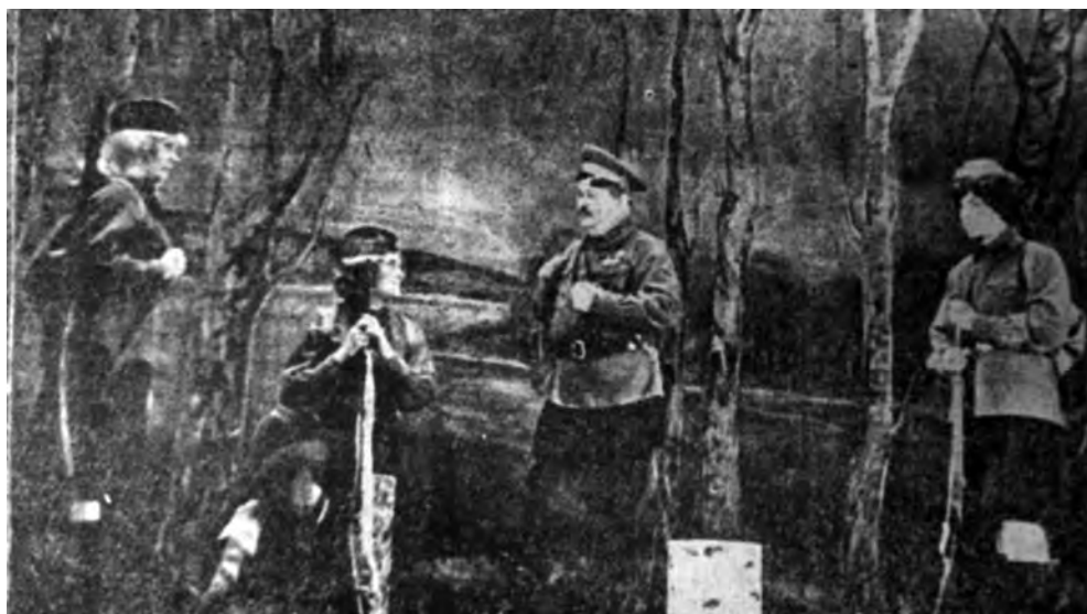
Фото 8. Сцена из оперы «Зори здесь тихие». Красное знамя. 1977. № 98 (27 апреля). С. 4 / A scene from the opera "The Dawns Here Are Quiet". Krasnoye znamya. 1977. No. 98 (April 27). P. 4

коллективом репертуара. По приводимым в публицистике и некоторых исследованиях данным невозможно понять, что они отражают – количество премьер или новых постановок. Так, журналист Н. Барабаш пишет, что за 20 лет деятельности (до 1979 г.) в театре сыграно 22 оперетты и 4 оперы [63], что не соответствует данным, собранным автором в процессе исторического обзора.